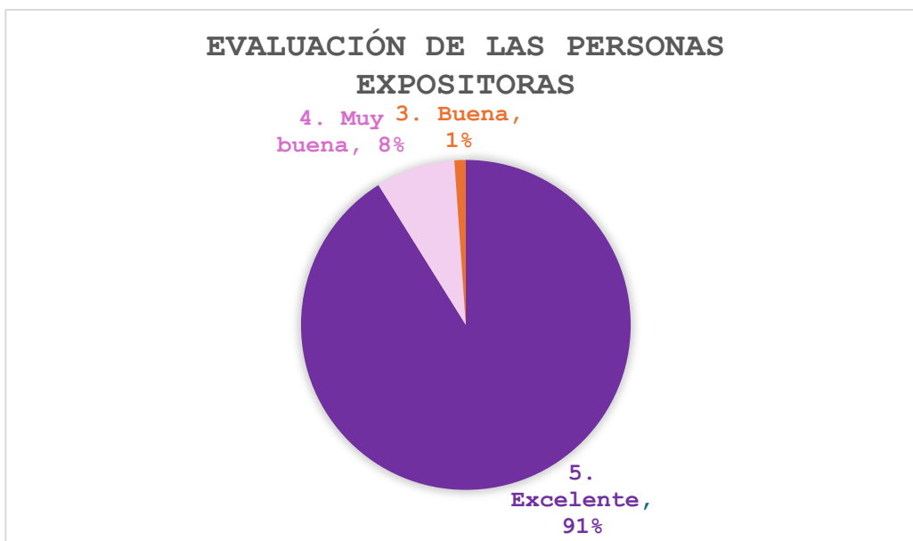
Grafica 3. Representación de los resultados a la aplicación de la evaluación de las personas expositoras, bajo las siguientes interrogantes: