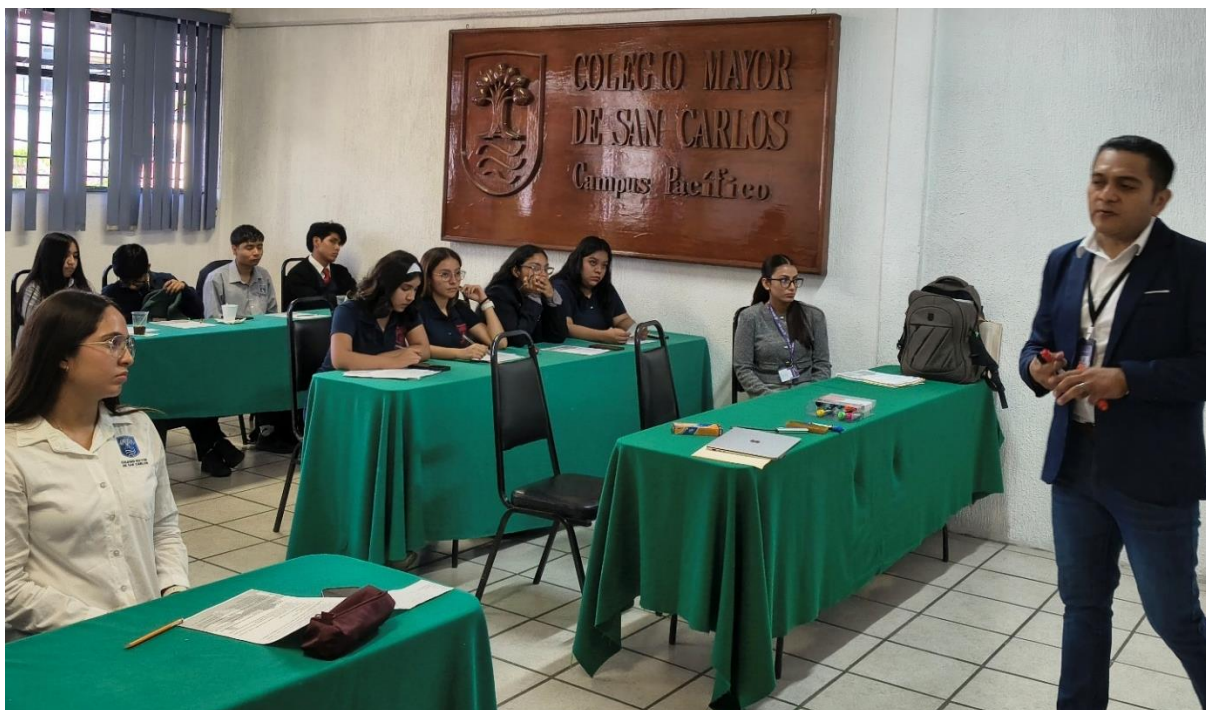
Fotografía 2. Asistencia al curso en la que se observa la participación del Encargado de la Coordinación de Despacho de Prerrogativas y Partidos Políticos