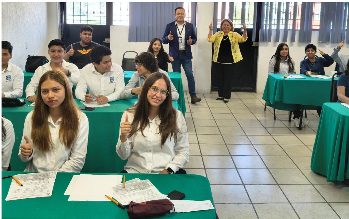
Fotografía 1. El Encargado de despacho de la Coordinación de Prerrogativas y Partidos Políticos, en acompañamiento por la Directora de Posgrados del Colegio Mayor de San Carlos, Campus Pacífico y alumnos de esa institución que tomaron el curso.