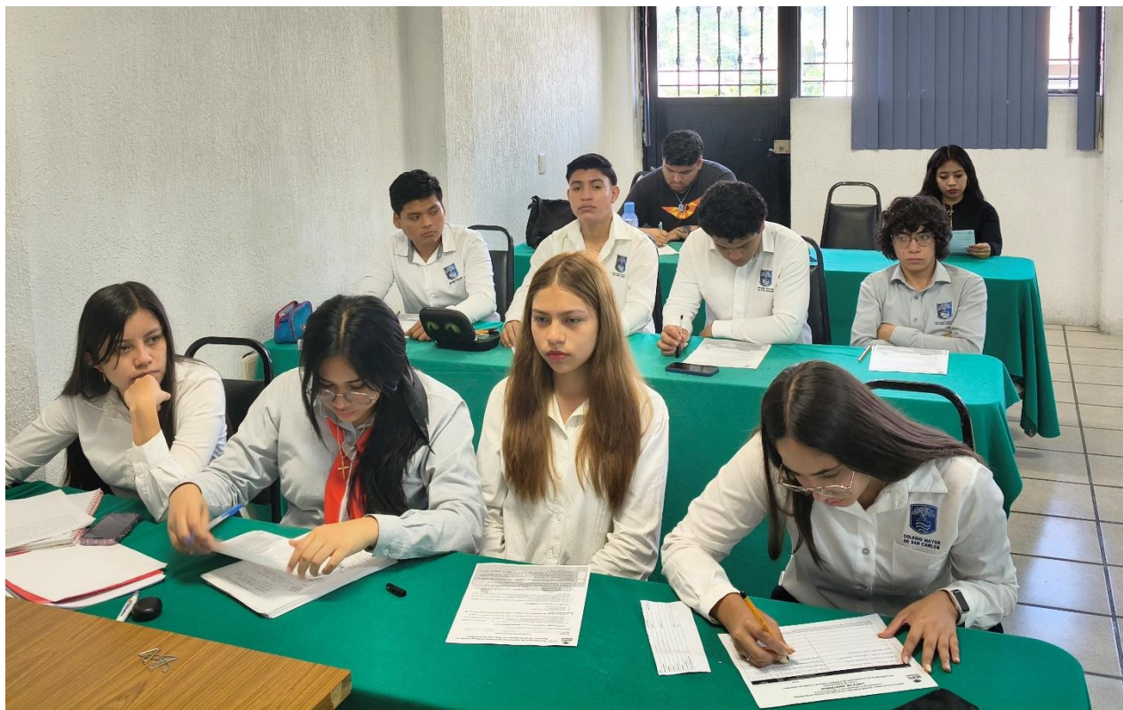
Fotografía 3. Alumnas y Alumnos del Colegio Mayor de San Carlos, que asistieron al curso “Procedimiento de Constitución de Partidos Políticos Locales en Guerrero.

ANEXO DEL INFORME 026/CPPP/SO/21-05-2026 EVIDENCIA FOTOGRÁFICA